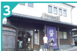
3 高田食品工業 株式会社