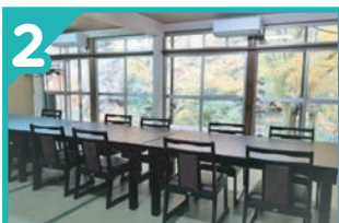
2 有限会社 みのり 割烹旅館みはる荘、農