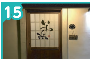
15 魚河岸味処 いわ浜