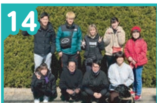
14 inHomeサービス ありむら