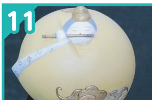
11 梶原博多人形工房