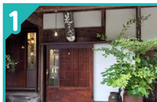
1 ギャラリー 花うさぎ