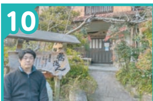
10 手打ちそば 蕎波人