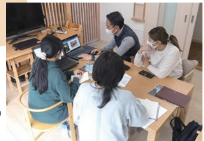
専門家の先生との 打ち合わせ風景。

アトピーや薬膳の知識を生かして考案されたメニューは、地元食材にこだわり、体に優しい素材でできています。明るく開放的な作業場で、楽しく働いています。