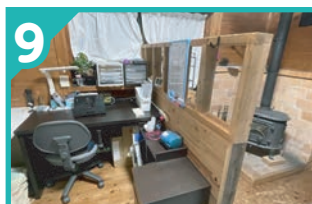
9 I・K・S(アイケイエス) ホーム