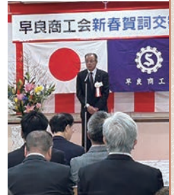
▲高田会長による主催者挨拶

改めまして、福引の商品をご協力いただいた皆様、運営にご協力いただいた皆様に感謝を申し上げます。